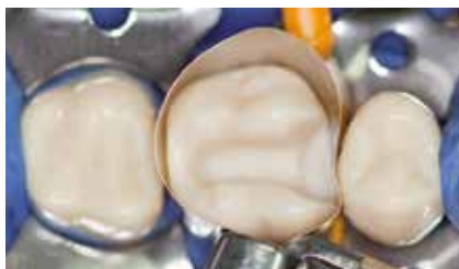
Fertig präparierte Kavität