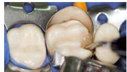
Am tiefsten Punkt der Kavität ansetzen ...