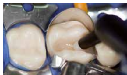
2 Millimeter Deckschicht GrandioSO einbringen