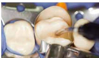
... und 4 Millimeter mit x-tra base füllen