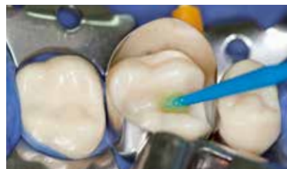
Benetzen der Kavitätenwände mit Futurabond DC