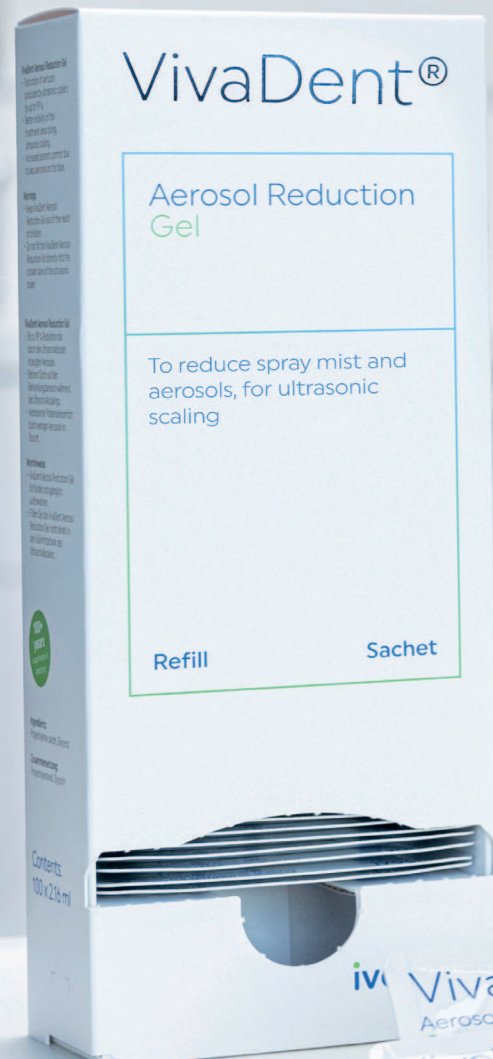
Ultraschallscaler mit Aerosol Reduction Gel