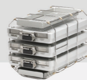
Halterung F Plus für 3 MELAstore® Box 100 und 2 schmale Tabletts