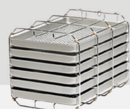
Halterung C Plus für 6 Standard-Tabletts

Die Tablettaufnahme-Gestelle sind für eine besonders einfache Bedienung im täglichen Betrieb entwickelt. Wenn die Aufnahme von sogar 4 MELAstore® Boxen gewünscht ist, können diese problemlos auch ohne Gestell in die Autoklaven eingeschoben werden.