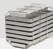
Halterung E Plus für 6 Standard-Tabletts und 2 schmale Tabletts