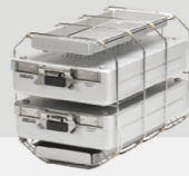
Halterung D Plus für 2 MELAstore® Box 200 und 2 schmale Tabletts