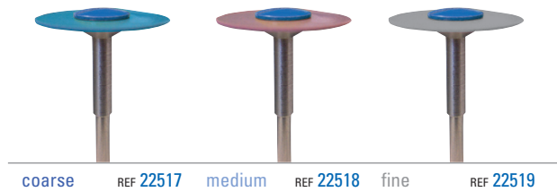
coarse REF 22517 medium REF 22518 fine REF 22519