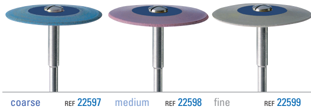
coarse REF 22597 medium REF 22598 fine REF 22599