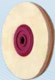
Wildleder/ Chamois Leather