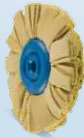
Wildleder/ Chamois Leather