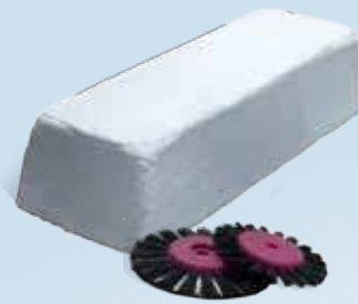
TOPDENT Universal-Polierpaste Universal-Polishing Paste

Für alle Metalle und zur Hochglanzpolitur von Kunststoffen. Beste Polierergergebnisse. For all metals and for high-lustre polish on resins. Best polishing results.