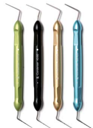
NiTi Condenser Set # 35/70, 40/80, 50/100, 60/120

American Dental Systems GmbH Günther Jerney Johann-Sebastian-Bach-Straße 42 · D-85591 Vaterstetten