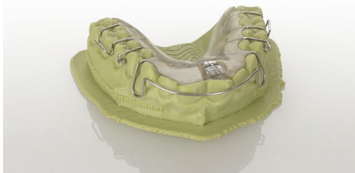
Вы можете продолжать работать с моделью без постобработки