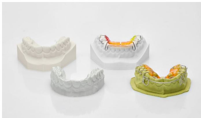
Рассчитаны на изготовление любых ортодонтических моделей