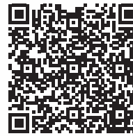
Proxeo Twist LatchShort