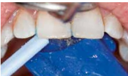
Sorgfältiges Ausspülen und Absaugen des Aufhellungsgels