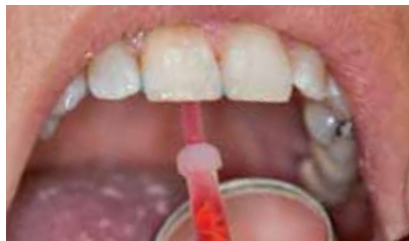
Einbringen des Aufhellungsgels in die Kavität mit beiliegender feiner Kanüle