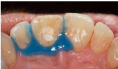
Palatinale Ansicht mit aufgetragenem Gingivaschutz LC Dam