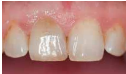
Deutlich sichtbare Verfärbung am Zahn 11