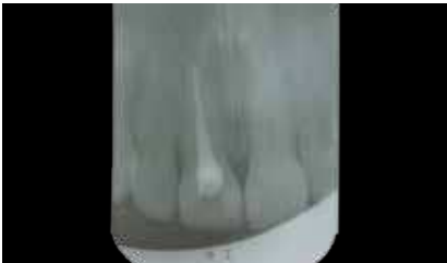
Randständige, klinisch einwandfreie Wurzelfüllung am Zahn 11