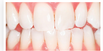
Nach der Zahnaufhellung mit Opalescence™