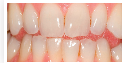
Vor der Zahnaufhellung mit Opalescence™