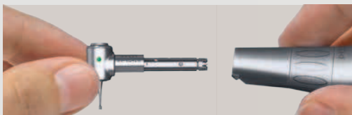
El cambio es sencillo: las cabezas INTRA de KaVo se adaptan a cualquier base de KaVo