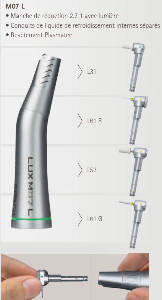
Changement facile : les têtes INTRA KaVo s'adaptent sur tous les manches KaVo

La gamme INTRA propose une multitude de têtes adaptables à vos besoins. Il vous suffit simplement d'insérer la tête souhaitée sur le manche du contre-angle. C'est simple, facile et polyvalent.