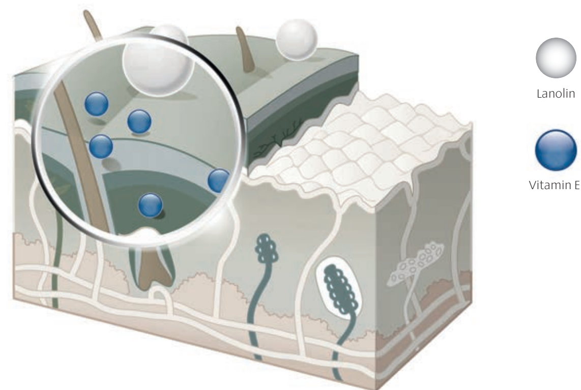
Kontinuierliche Abgabe von Lanolin und Vitamin E über die LANOLIND® Beschichtung.