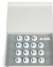
109-0020EU CERABIEN™ MiLai INTERNAL STAIN KIT