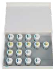
109-0010EU CERABIEN™ MiLai MICRO LAYERING KIT