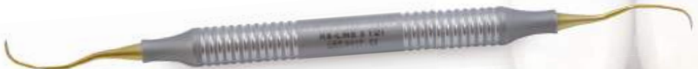
KKD® mf RB-LINE TiZi 3 Titan-Implantatkürette Titanium implant curette

Universalinstrument mit zirkonnitridbeschichteten Arbeitsspitzen aus Titan. Die Arbeitsspitzen ermöglichen eine sichere Biofilmentfernung bei der Erhaltungstherapie an Implantaten. Die schlanke Form und spezielle Abwinkelung ermöglichen einen atraumatischen Zugang selbst bei dünnen und engstehenden Implantaten. Die Spezialbeschichtung verhindert ein schnelles Stumpfwerten, die Beschädigung der Implantatoberfläche und einen Metallabrieb. Im Vergleich zu Karboninstrumenten zeichnet sich das Instrument durch präziseres und effektiveres Arbeiten aus.