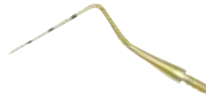
KKD® mf RB-LINE TiZi 2 Titan-Parodontometeraufsatz UNC 15 Titanium probe tip UNC 15

Die spezielle Zirkonnitridbeschichtung des Parodontometeraufsatzes ermöglicht eine sehr kontrastreiche Beurteilung der Eindringtiefe der Sonde im periimplantären Sulkus. Die Millimetereinteilung ermöglicht eine exakte Sulkustiefenmessung. Schaft mit M 2,5 mm Gewinde. The special zirconium nitride coating of the tip enables a very rich-in-contrast evaluation of the penetration depth of the probe in the peri-implant sulcus. The millimetre gradations allow an exact measurement of the sulcus depth. The shank is furnished with a M 2.5 mm screw thread.