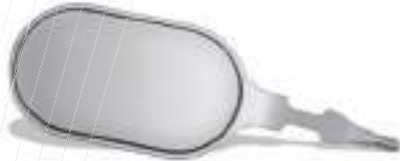
KKD® mf RB-LINE 1 Mundspiegel Mouth Mirror