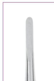
#6 3,0 mm REF 11876