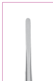
#5 2,0 mm REF 11875