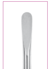
#4 5,0 mm REF 11874