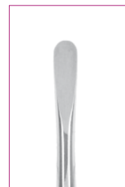
#7 4,0 mm REF 11877