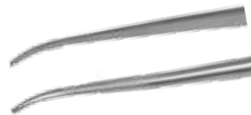
gebogen (45°)/ curved L: 18 cm TP33M18c REF 13706