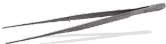
Semken-Taylor - gerade/ straight