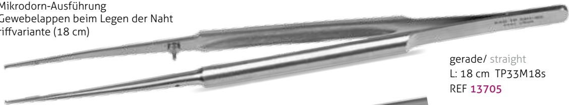
gerade/ straight L: 18 cm TP33M18s REF 13705