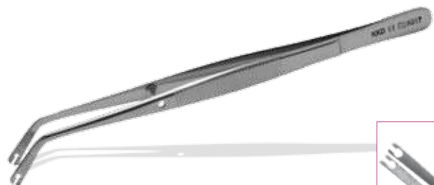
SP-20 Corn L: 15 cm