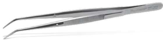
DP-17 College L: 15,5 cm REF 12184