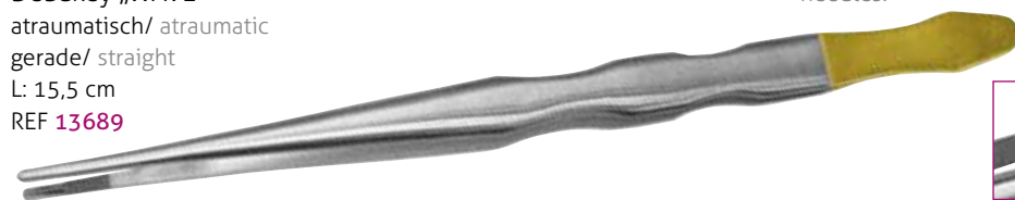
DeBakey „WAVE“ atraumatisch/ atraumatic gerade/ straight L: 15,5 cm REF 13689

Sicheres Halten von Schleimhautgewebe. Spezielle Zahnung verhindert eine Gewebe-Perforation. Safe grip of mucosal tissue. Special serration prevents perforation of tissues.