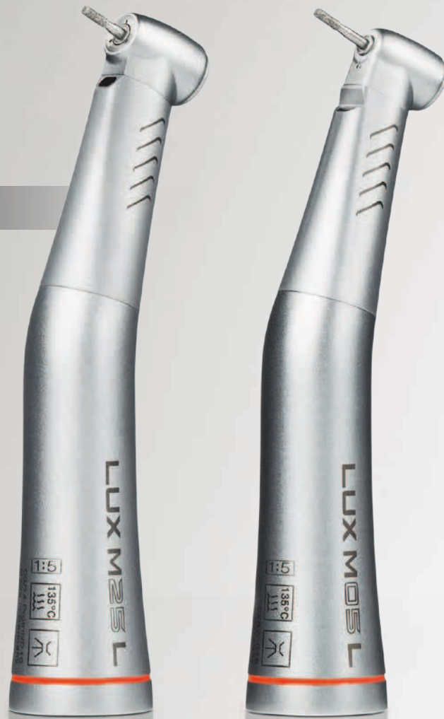
KaVo MASTERmatic M25 L