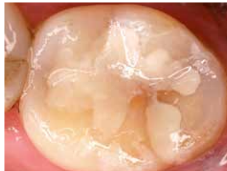
Nachher: Die typisch rau und stumpf wirkende Oberfläche von Glas Ionomer-Materialien wird durch Easy Glaze aufgehoben. Die mit Easy Glaze veredelte Füllung fühlt sich für den Patienten nicht nur glatter an, sondern sieht auch ästhetisch aus.