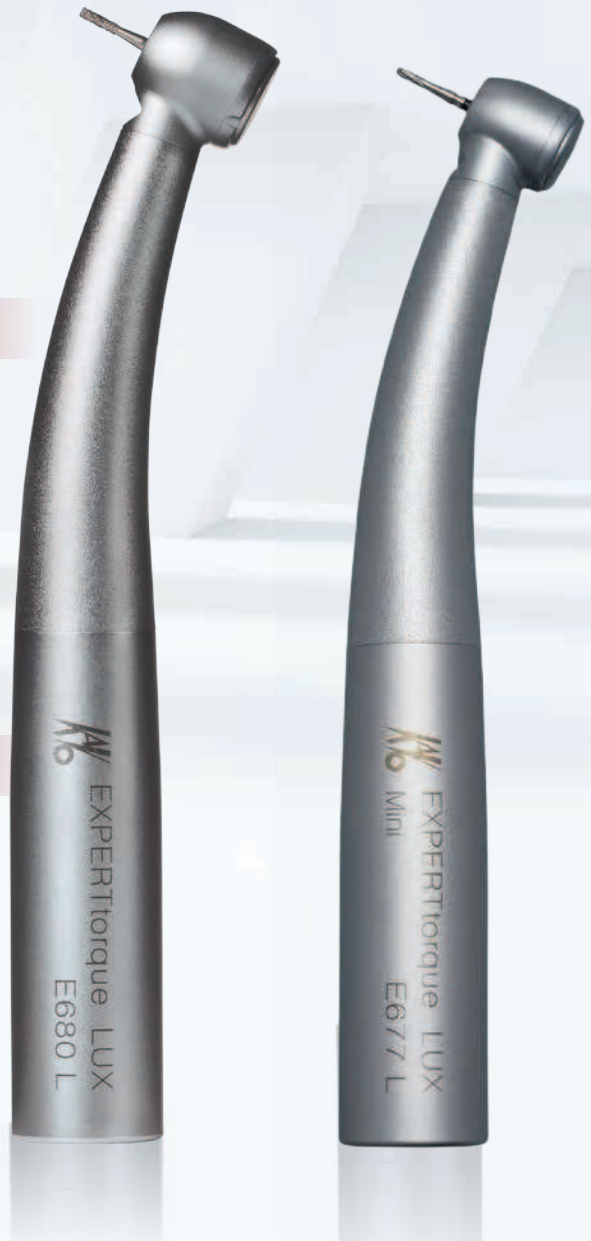
KaVo EXPERTtorque LUX E680 L