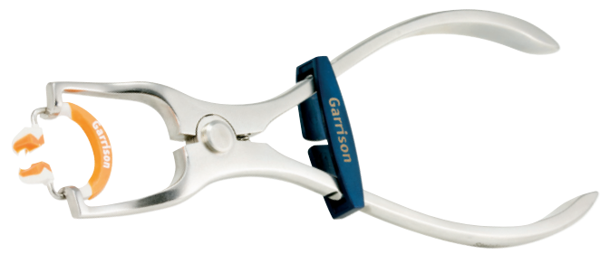
Composi-Tight® 3D Fusion™ Ringseparierzange Art.Nr. FXP01

Das Teilmatrizensystem für alle Klasse II Kavitäten