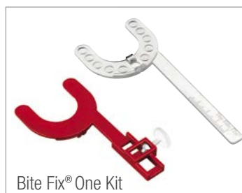
Bite Fix® One Kit

Bite Fix® One ist preisgünstig und anwenderfreundlich.