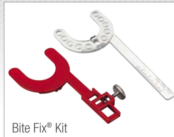
Bite Fix® Kit

Zudem ist die Bite Fix® Bissregistrierung aus sterilisierbarem Kunststoff, der Grundkörper (rot) ist mehrfach verwendbar.