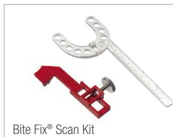
Bite Fix® Scan Kit

Und: Durch die integrierte Sollbruchstelle an der Bissgabel ist Bite Fix® Scan passend für jeden Scanner.