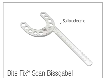
Bite Fix® Scan Bissgabel