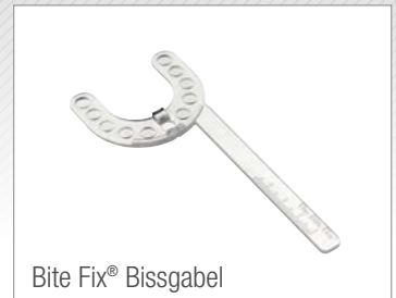
Bite Fix® Bissgabel