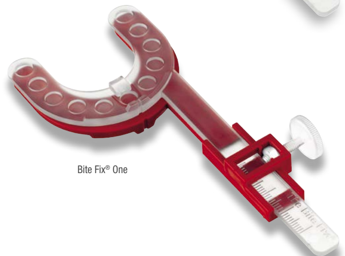
Bite Fix® One

Diese Eigenschaften haben unsere Bite Fix® Bissregistrierungen gemeinsam: