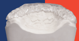
Aufbiss-Schutz im Normalzustand

A deformed CLEARsplint® comfort splint adapts easily and precisely to the teeth thanks to the thermoactive property of the material and its excellent flexibility. Even under heat, the perfect surface hardness is maintained.