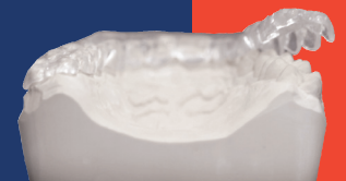
Eine verformte CLEARsplint® Komfort-Aufbisschiene passt sich dank der thermoaktiven Eigenschaft des Kunststoffes und dessen exzellenter Flexibilität einfach und präzise wieder an die Zähne an. Die gute Oberflächenhärte geht auch unter Wärme nicht verloren.

thermoactive bite protection self-adjusting and very flexible