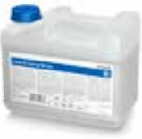
Aniosyme Synergy WD Plus 5 Liter Kanister

Monoenzymatischer Reiniger mit alkalischer Reinigungsleistung